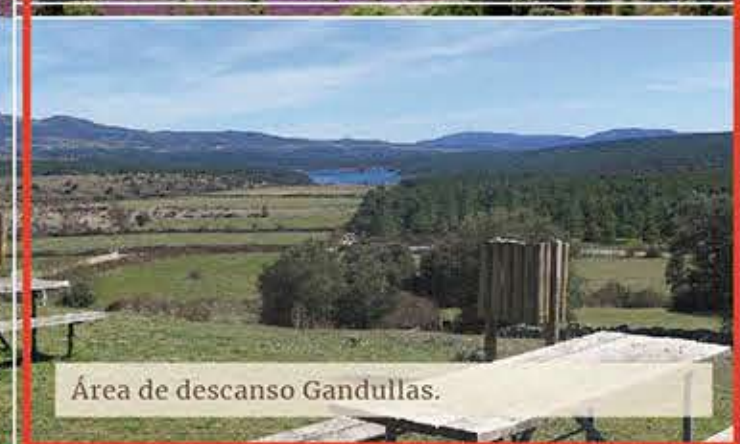
Área de descanso Gandullas.