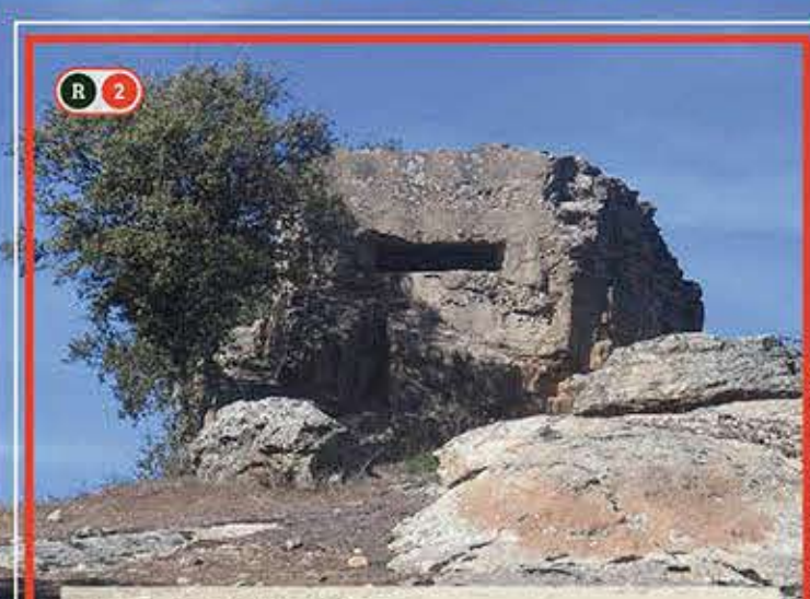
Bunker Peña Zorreras.

Detrás de la iglesia sale el camino que nos llevará de vuelta al cementerio. El paisaje cambia por completo. Prados de pasto verde y muros de piedra bordeando las fincas nos llevan hasta un chopo desmochado con un nido de cigüeña en la copa. Giramos a la derecha para coger la "Colada de la Zarcilla" y tomamos el primer desvío a la izquierda que nos llevará en permanente ascenso hasta el cementerio.