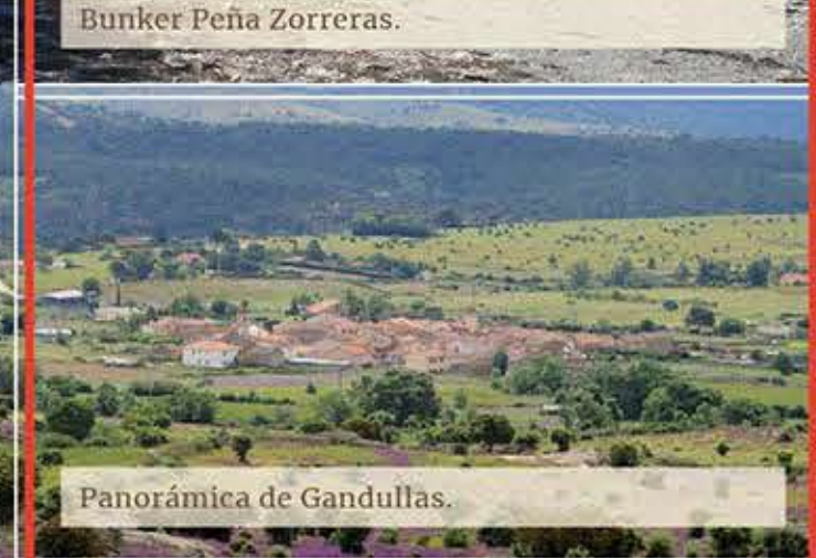
Panorámica de Gandullas.